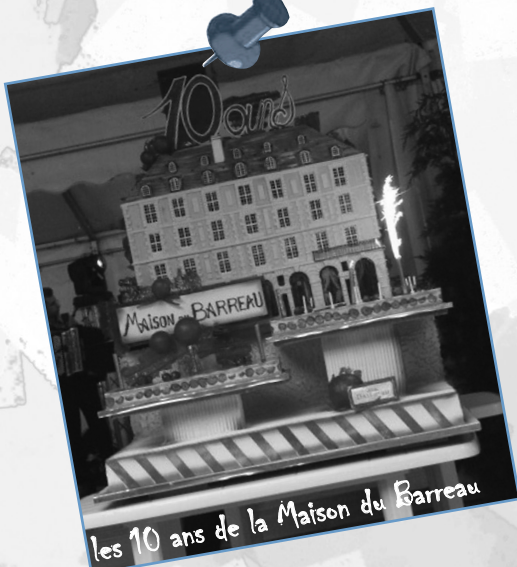
les 10 ans de la Maison du Barreau