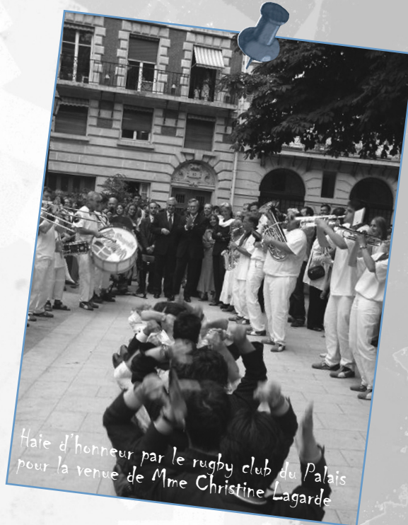
Haie d'honneur par le rugby club du Palais pour la venue de Mme Christine Lagarde