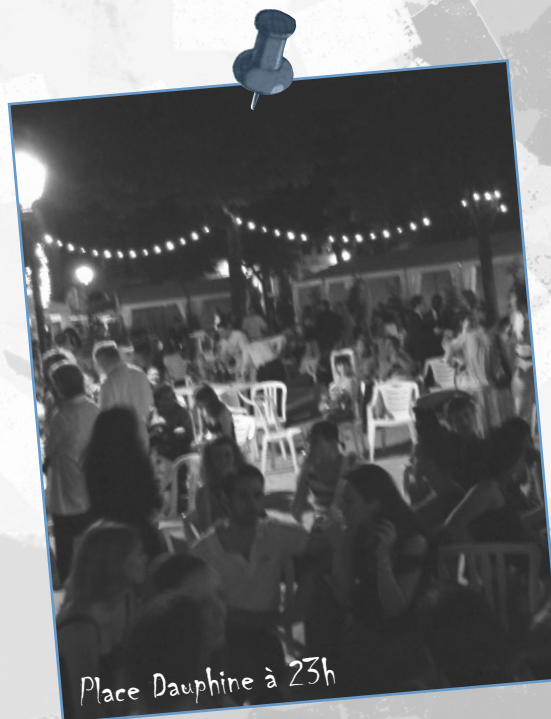
Place Dauphine à 23h