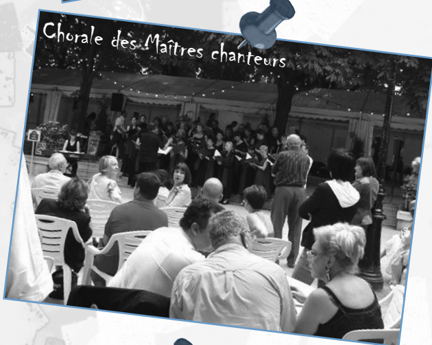
Chorale des Maîtres chanteurs